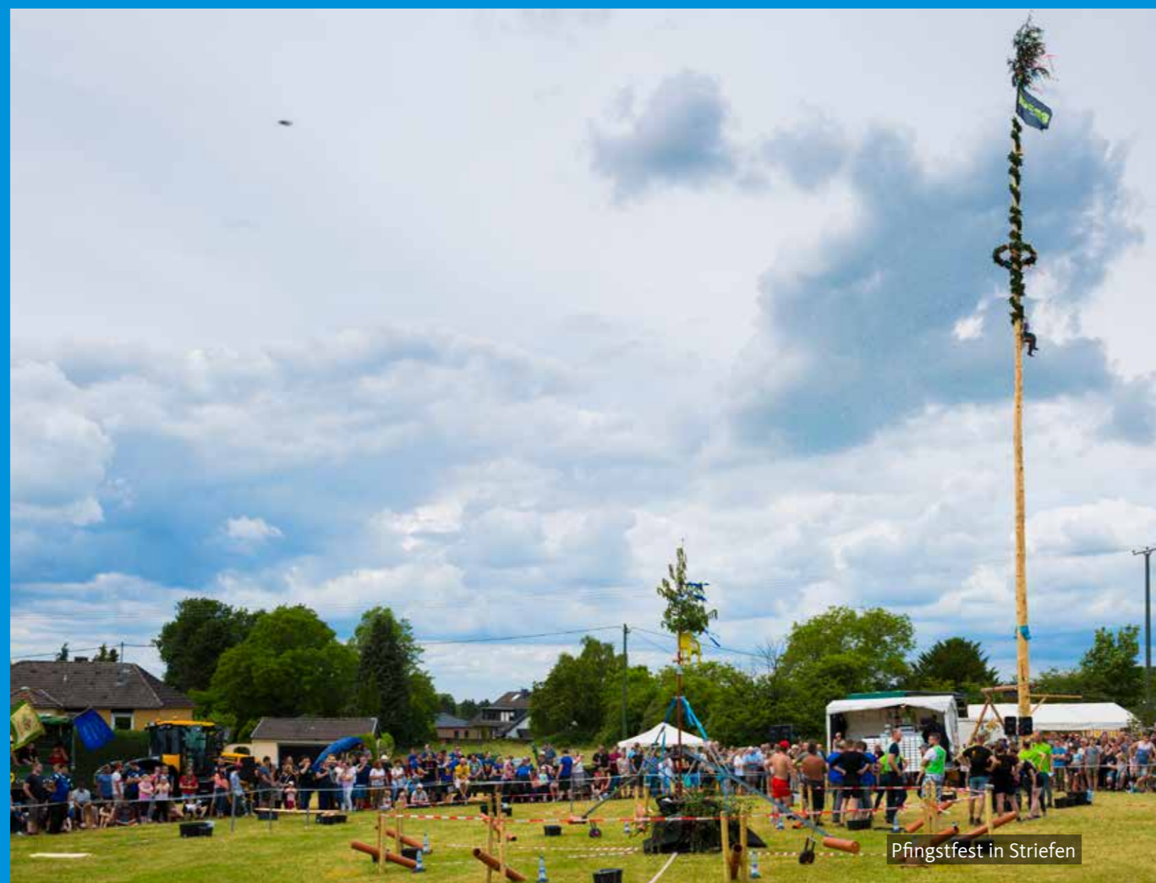
Pfingstfest in Striefen

Zugleich ist Hennef fest eingebunden in das Netz der Europäischen Partnerschaft. Mit drei Städten hat Hennef besonders enge Freundschaften geschlossen: Seit 1981 ist die eng-