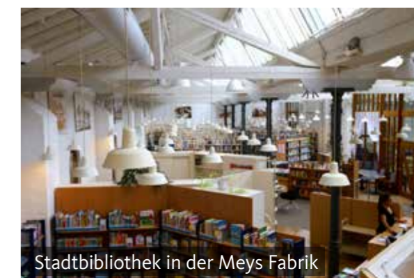
Stadtbibliothek in der Meys Fabrik

Die Musikschule der Stadt hat in den mehr als 65 Jahren ihres Bestehens viele hundert Schülerinnen und Schüler ausgebildet. Einige von ihnen haben auf der Grundlage dieser Ausbildung sogar den Sprung in einen musikalischen Beruf geschafft. Für alle Schülerinnen und Schüler ist die Musik jedoch zu einer wertvollen Begleitung auf ihrem Lebensweg geworden. Und in jedem Fall