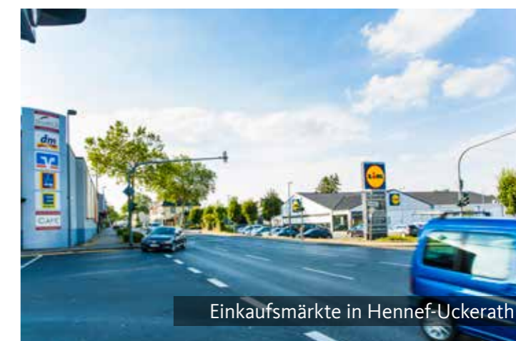
Einkaufsmärkte in Hennef-Uckerath

eine schöne Stadt, in der man gut und gerne lebt, eine offene Stadt, in der Fremde Freunde werden, eine digitale Stadt mit tiefen Wurzeln, eine heimelige Stadt, die keinen Staub ansetzt, eine Stadt, die Platz zum Arbeiten bietet, eine bewegte Stadt mit Sport im Herzen, eine musikalische Stadt mit Kultur im Blut, eine Stadt, in der Kinder Platz zum Spielen haben, eine Stadt mit mehr grün als grau. Unsere Stadt. Hennef.