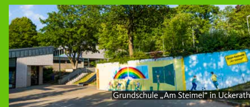
Grundschule „Am Steimel“ in Uckerath

Bleiben wir beim Thema Schulen, denn dazu gibt es noch mehr zu erzählen. 1.420 Kindergartenkinder und über 6.000 Schülerinnen und Schüler – Hennef verfügt über eines der umfassendsten Bildungssysteme des Rhein-Sieg-Kreises. Acht Grundschulen – sieben mit offener Ganztagschule – versorgen die Stadt flächendeckend. Hinzu kommen zwei städtische Gesamtschulen, eine private Gesamtschule mit dem Schwerpunkt Kunst und ein städtisches Gymnasium. Außerdem gibt es in Hennef ein Berufskolleg, den Campus