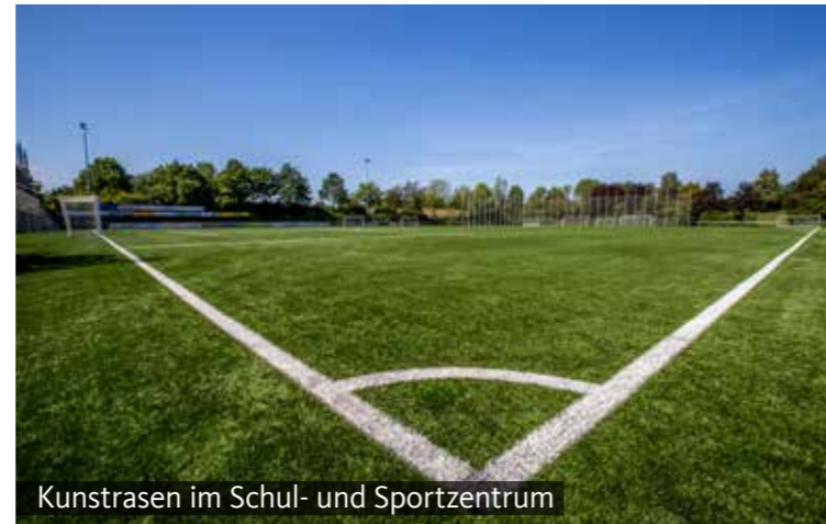
Kunstrasen im Schul- und Sportzentrum

Sportstadt Hennef: 50 Sportvereine mit über 11.000 Mitgliedern, die Hälfte Kinder und Jugendliche – das spricht für Hennef. Die Stadt hat in den letzten Jahren viel Geld in die Sport-Infrastruktur investiert. Neben der laufenden Verbesserung bestehender Sportstätten wurden Kunstrasenplätze, zahlreiche Kleinspielfelder und Soccercourts, eine Außensportanlage, mehrere Sporthallen und eine neue Gymnastikhalle gebaut. Außerdem wurden das Stadion um eine Tribüne erweitert und die Leichtathletikanlagen erneuert. Viele weitere Projekte sind in Planung. Kürzlich hat die Stadt sogar die alte Minigolfanlage im Kurpark und das dortige Schachfeld erneuert. Merke: In Hennef haben sogar die Schachspieler ein Stadion.