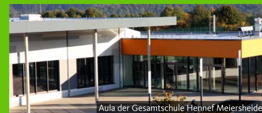
Aula der Gesamtschule Hennef Meiersheide