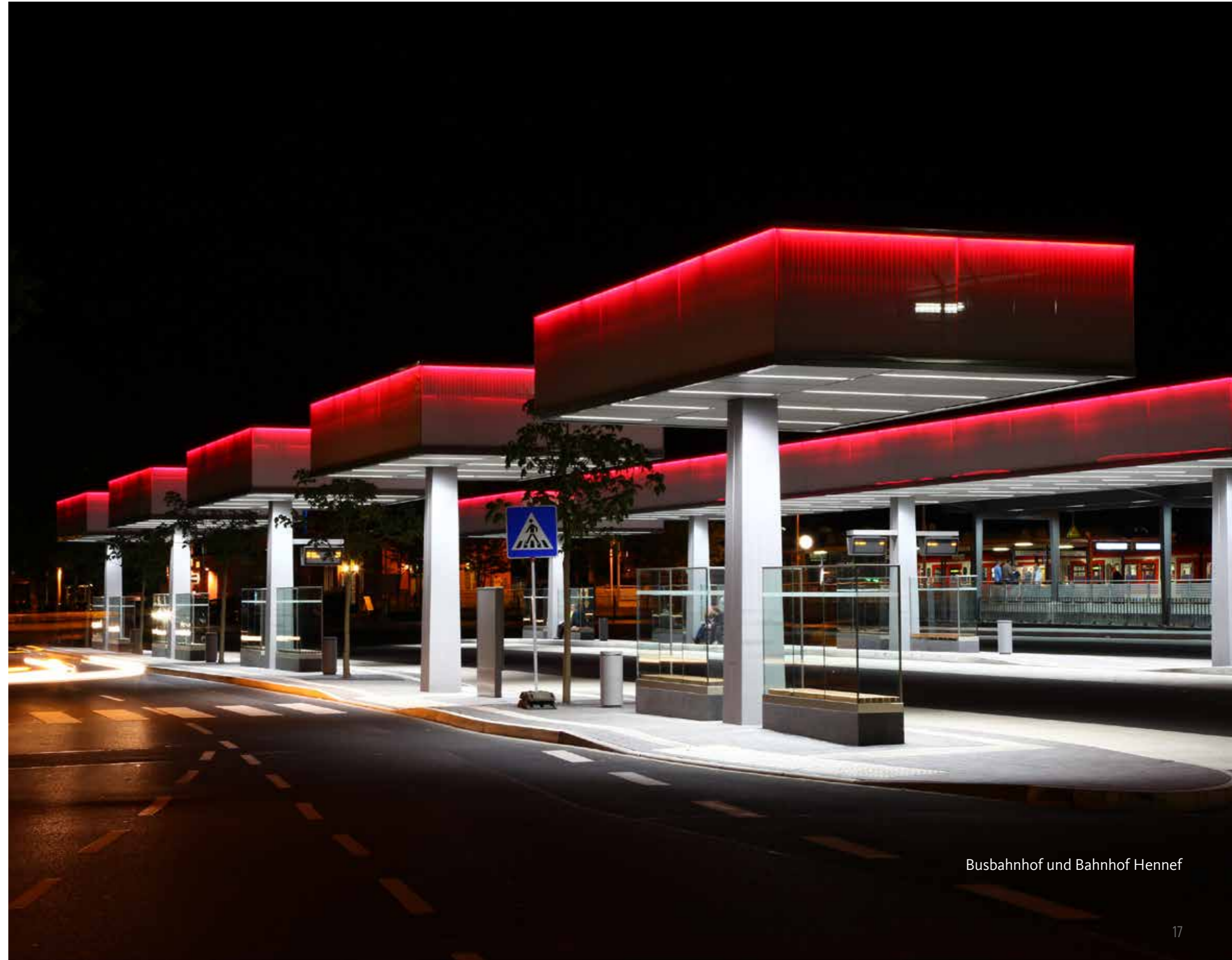
Busbahnhof und Bahnhof Hennef

Dazu passt übrigens auch, dass die Hennefer Firmen den Service der städtischen Wirtschaftsförderung schätzen. Kurze Wege und unbürokratische Unterstützung, gerne auch vom Bürgermeister selber – Wirtschaft ist in Hennef Chefsache.