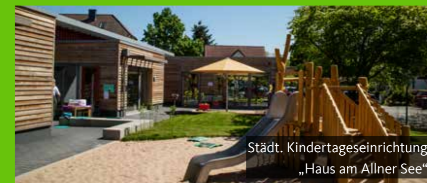
Städt. Kindertageseinrichtung „Haus am Allner See“