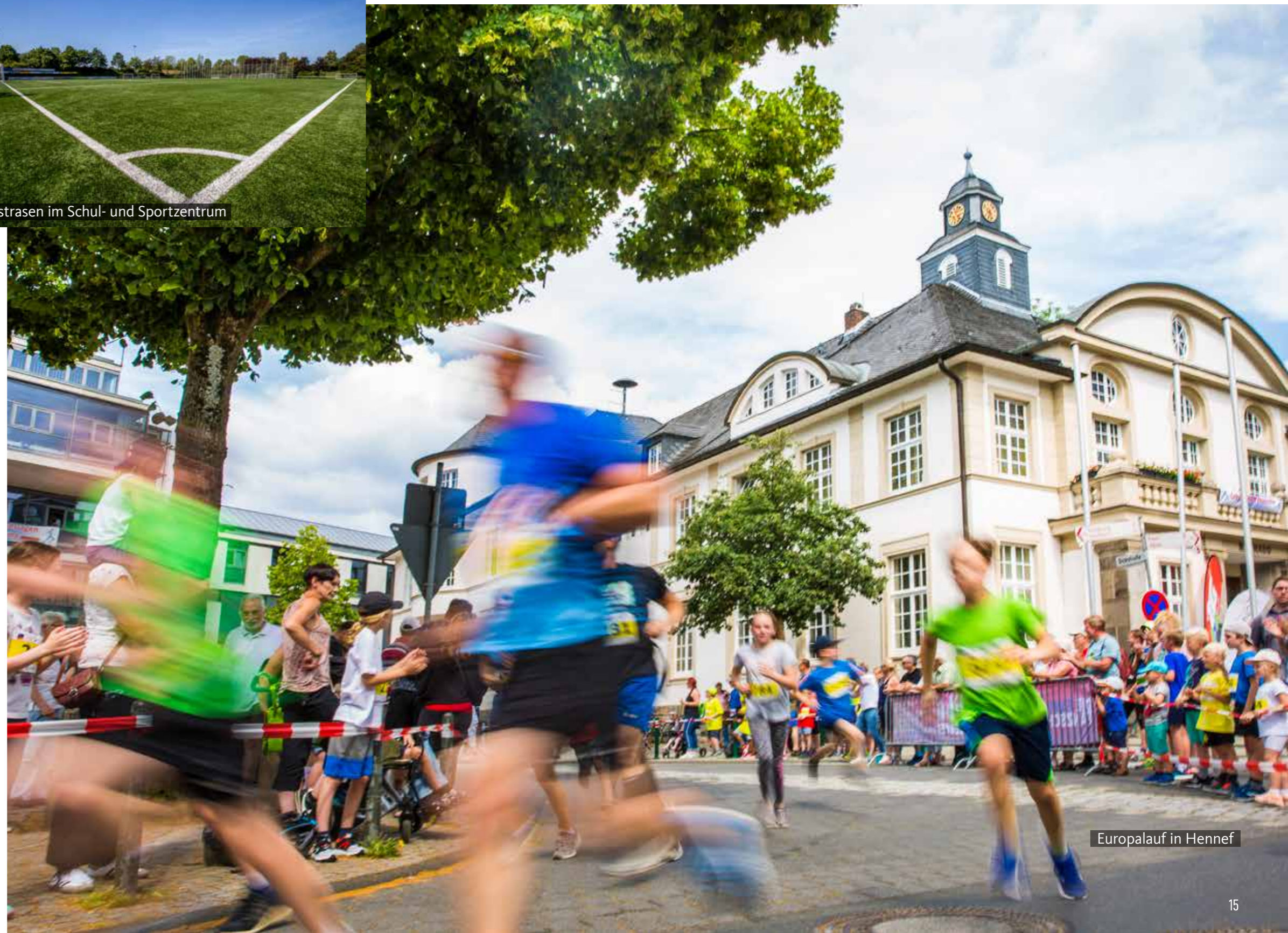
Europalauf in Hennef

Nicht zu vergessen der Europalauf mit Strecken bis zum Halbmarathon, der jedes Jahr im Juni stattfindet. 2.000 Läuferinnen und Läufer gehen dabei an den Start.