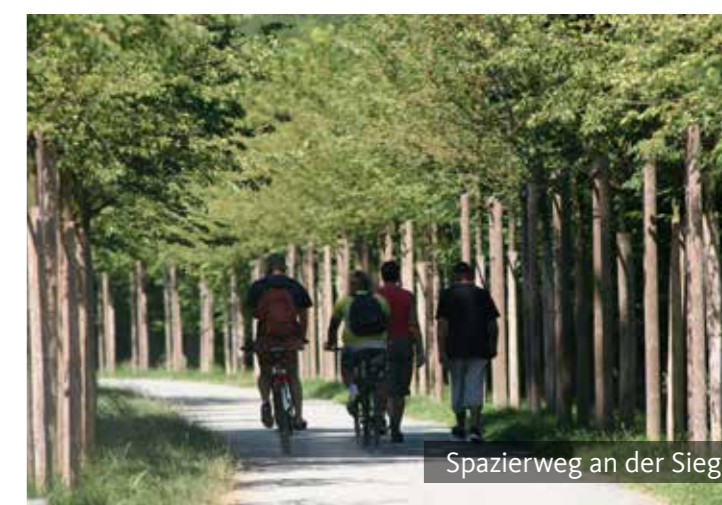
Spazierweg an der Sieg