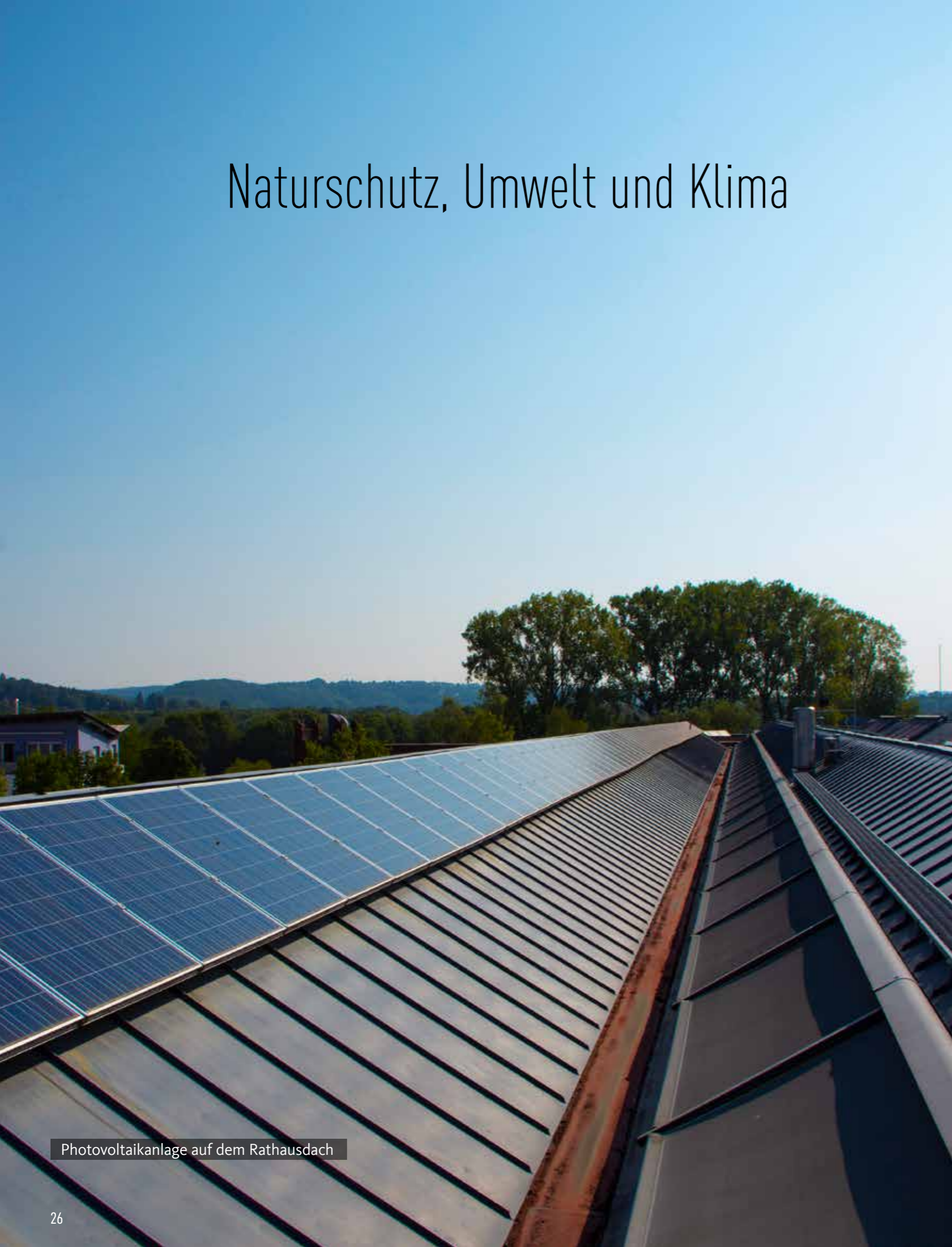
Photovoltaikanlage auf dem Rathausdach

Hennef macht sich auf allen Ebenen stark für eine lebenswerte Zukunft zum Wohle aller in einer intakten Natur und Umwelt.