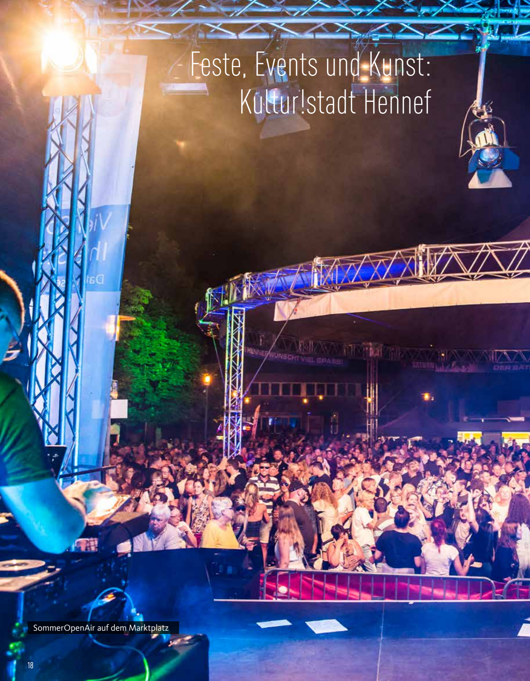
SommerOpenAir auf dem Marktplatz