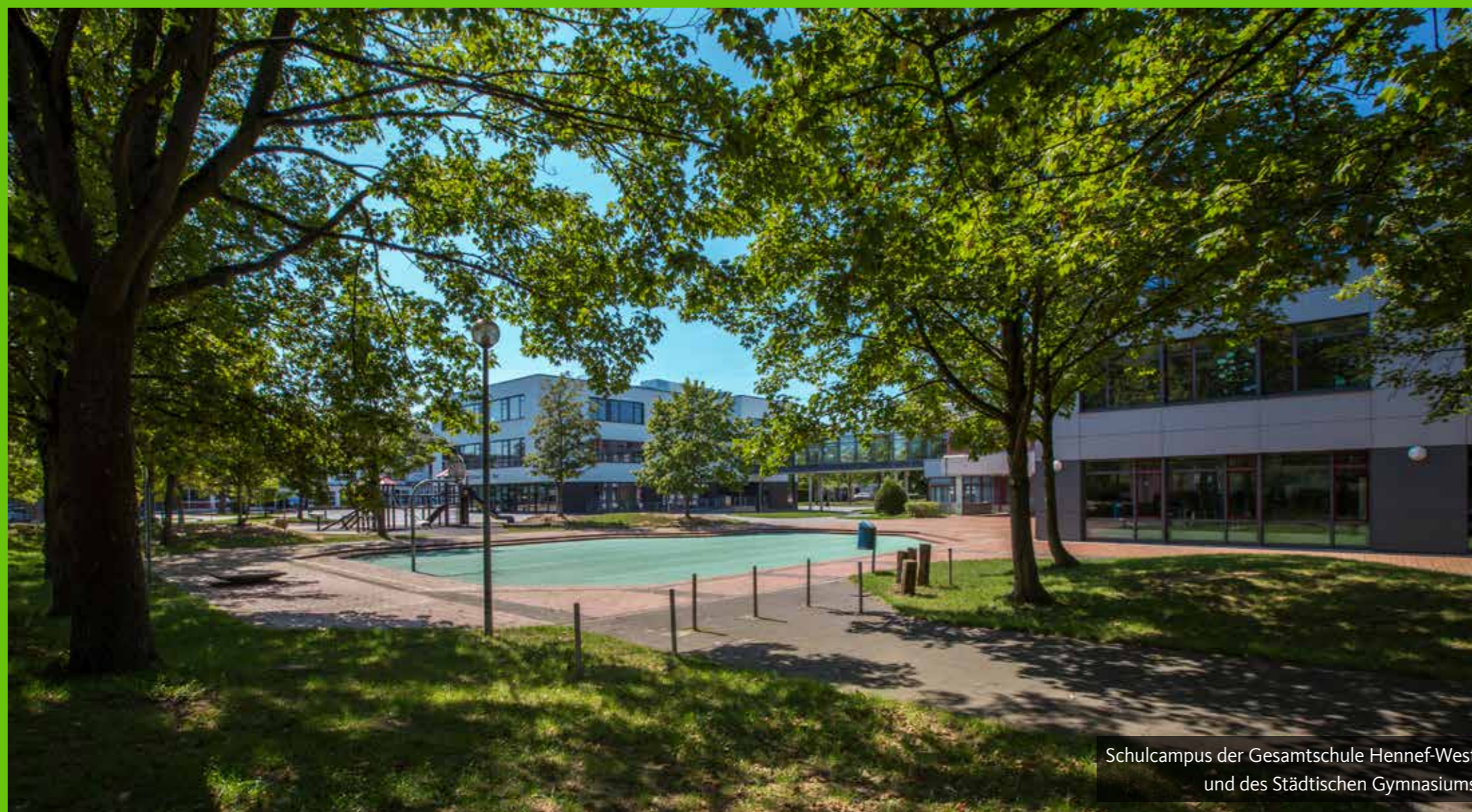
Schulcampus der Gesamtschule Hennef-West und des Städtischen Gymnasiums

Acht Grundschulen – sieben mit offener Ganztagschule – versorgen die Stadt flächendeckend. Hinzu kommen zwei städtische Gesamtschulen, eine private Gesamtschule mit dem Schwerpunkt Kunst und ein städtisches Gymnasium.